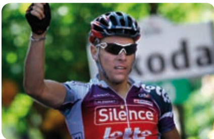
➤ Philippe Gilbert won een rit in de Giro.

Callant Verzekeringen is eveneens supplier van het Topsport Vlaanderen-Mercator cycling team. Hierover leest u meer in onze volgende nieuwsbrief. www.topsport-vlaanderen.be